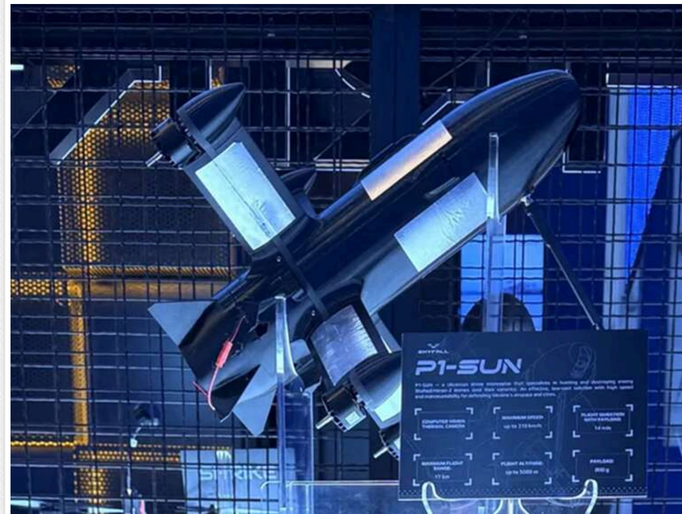
Здатні самостійно нищити «шахеда»: розробники презентували безпілотники P1-SUN Long

В Україні презентували нову версію дронів-перехоплювачів SkyFall – модель P1-SUN Long, оснащену технологіями штучного інтелекту.