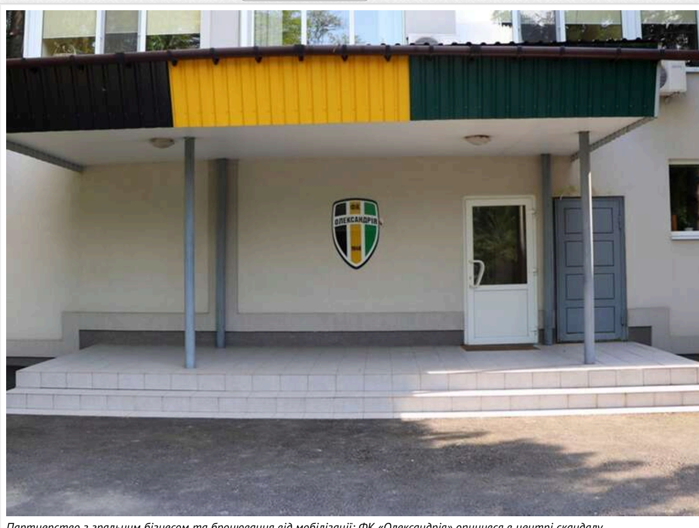
Партнерство з гральним бізнесом та бронювання від мобілізації: ФК «Олександрія» опинився в центрі скандалу

Футбол, ставки, мільярди та скандали з бронюванням. Схоже, у ФК «Олександрія» сезон інтриг триває не лише на полі.