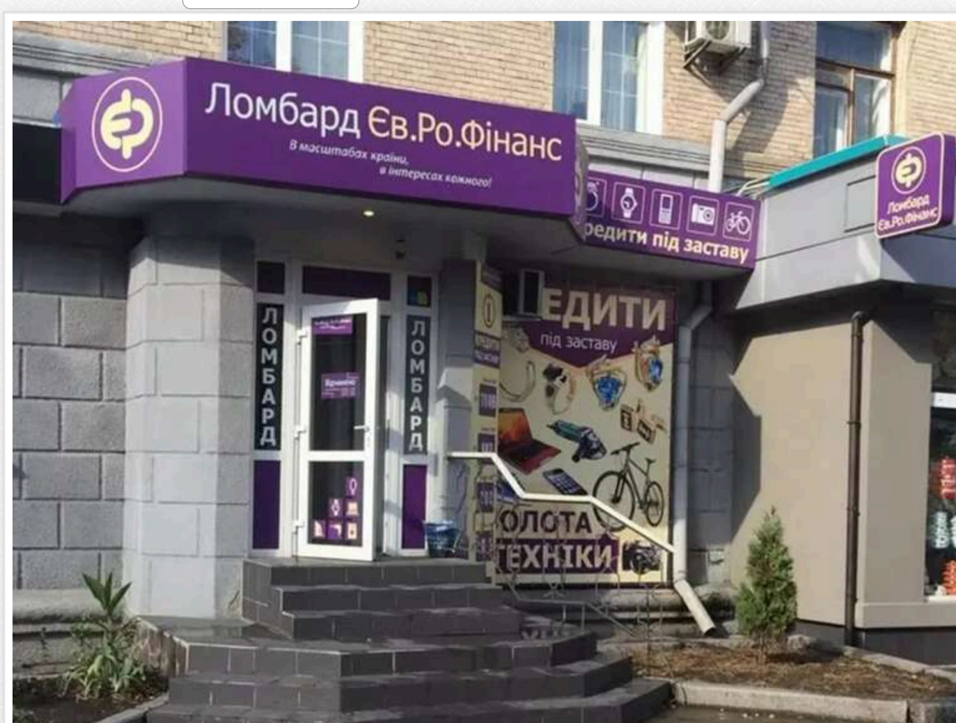
Хто такий Дмитро Петров і як ломбардний бізнес «з офшорів» заробляє на збіднілих українцях

Читати на російськом | Додати як бажане джерело в Google