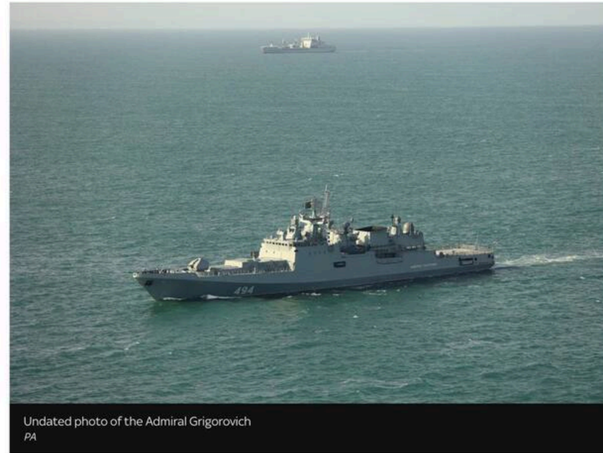
Undated photo of the Admiral Grigorievich

The warship is thought to have sounded an alert to the yacht to avoid a collision but it didn't change course, so a couple of warning shots were fired - though not directly at the yacht.