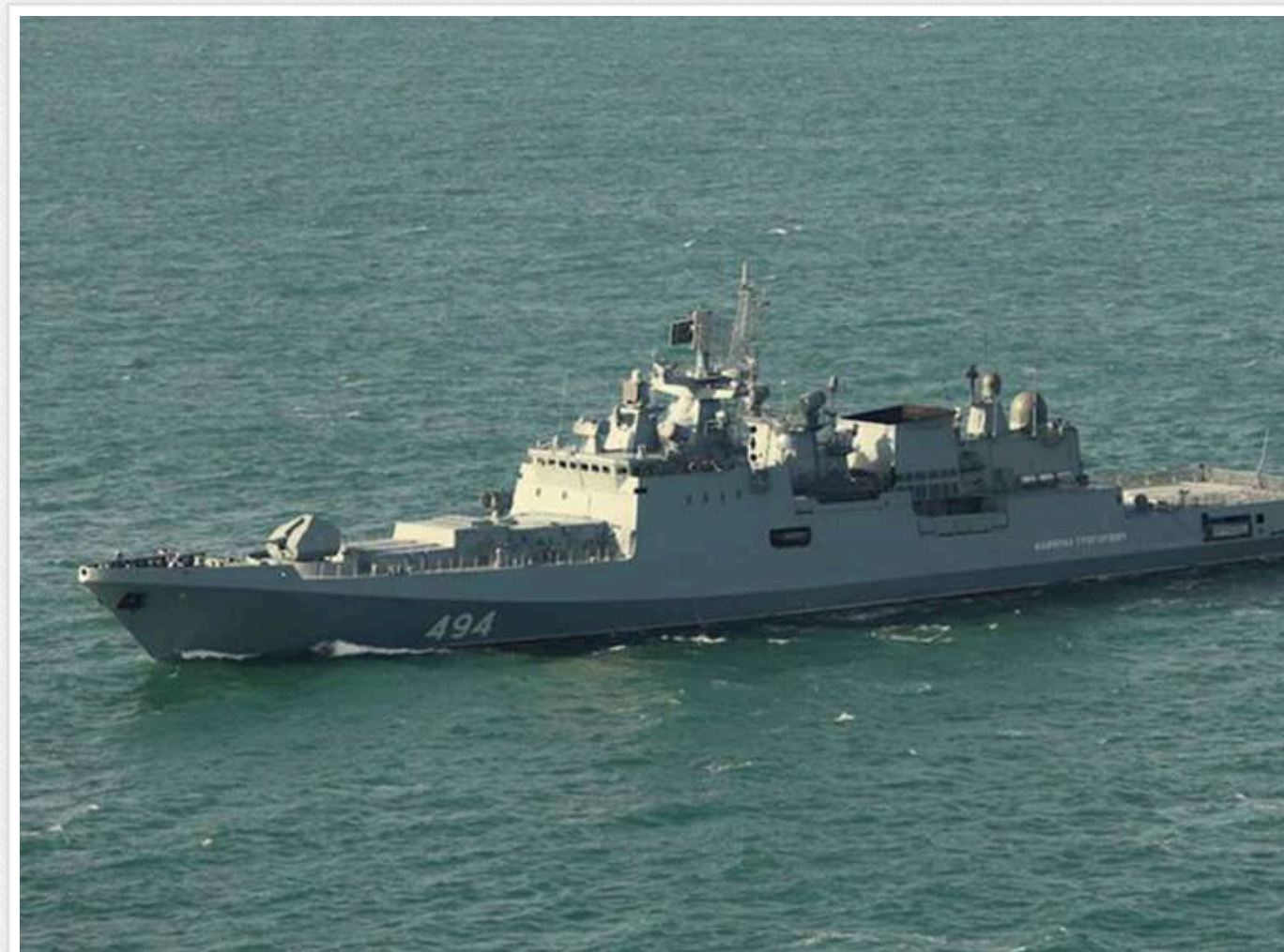
Інцидент у Ла-Манші: в Міноборони Британії назвали розумними попереджувальні постріли російського фрегата

У Великій Британії інцидент з російським фрегатом «Адмірал Григорович», який, за попередніми повідомленнями, відкрив попереджувальний вогонь по британській яхті, коментують досить стримано і без зайвого драматизму.