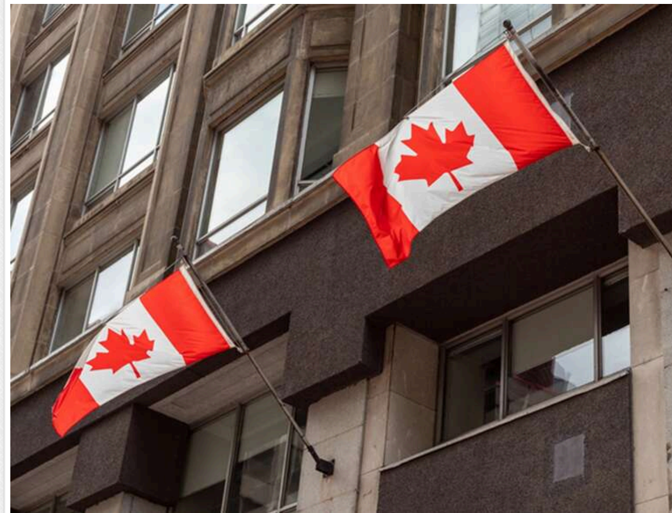
Канада розширила санкції проти РФ: під удар потрапили біржі, банки та 120 суден «тіньового флоту»

Канада запровадила новий пакет санкцій проти російських бірж, банків та тіньового флоту.