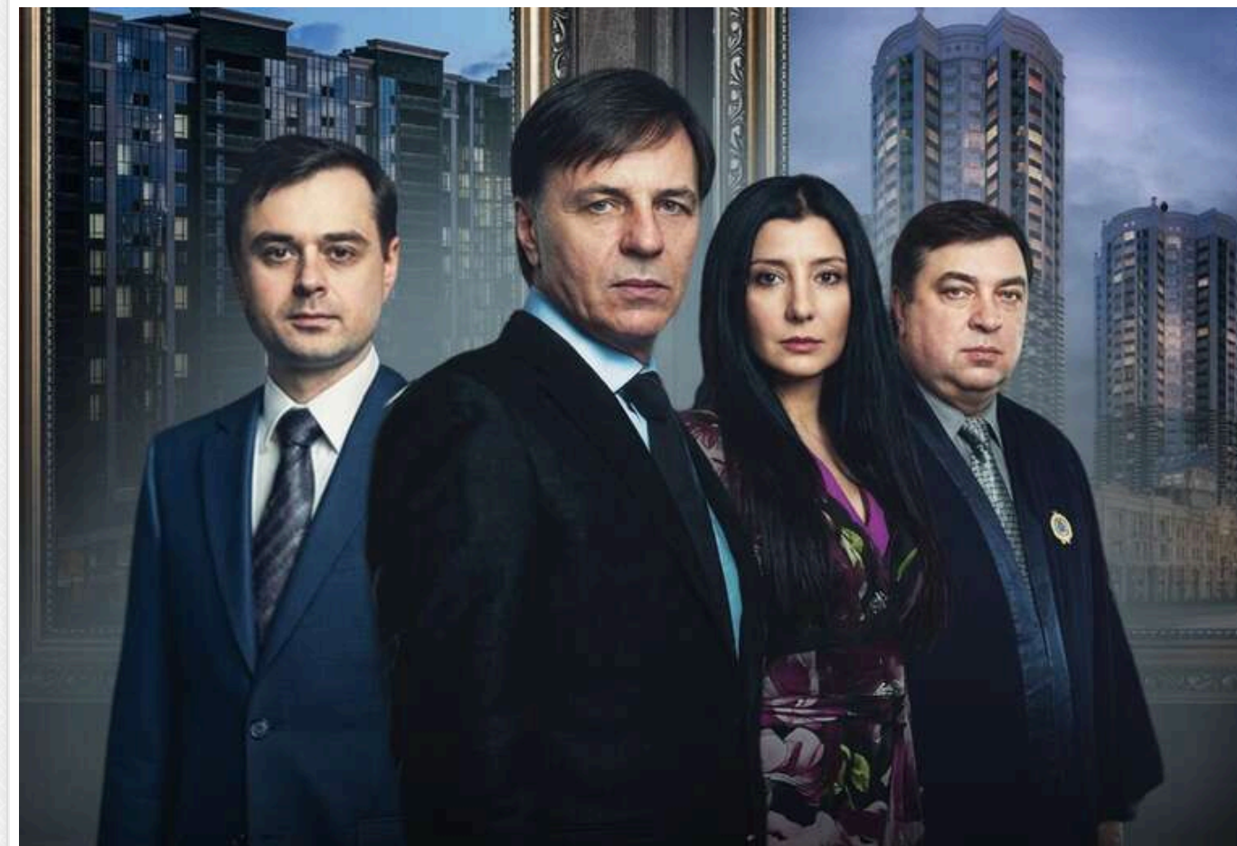
Елітні котеджі, квартири в центрі та 25 паркомісць: як родина ексголови ДСА Карабаня обросла активами

Читати на руськом Read in English Додати як бажане джерело в Google