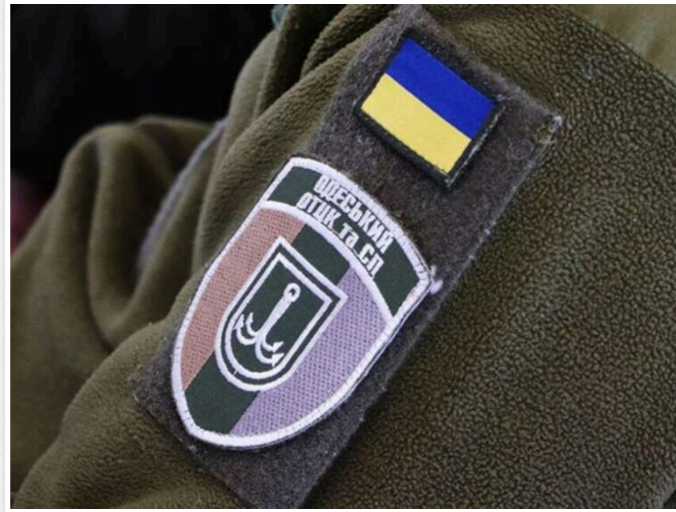
Суд оштрафував ексспеціаліста ТЦК за хабарництво: сума застави вдвічі перевищила його річний дохід

Читати на руском Додати як бажане джерело в Google