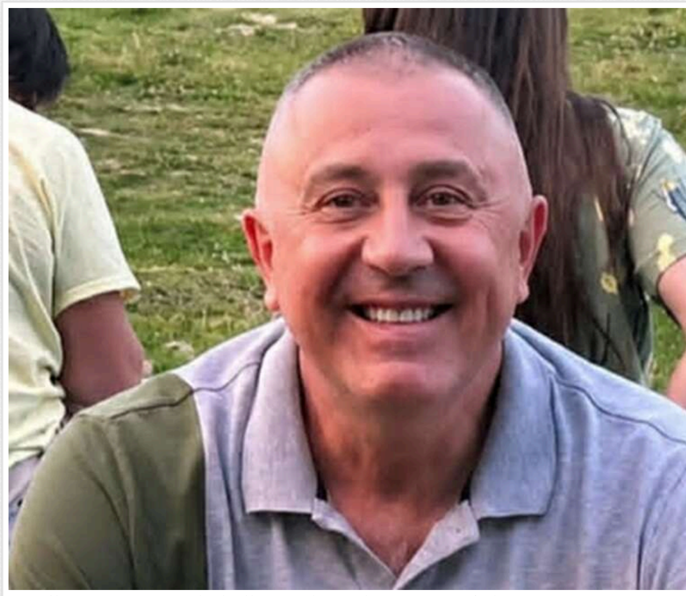
Майже 20 мільйонів на картках при доході в 187 тисяч: суд розкрив деталі фінансових обмудок «положенця» Науменка

Читати на руском Додати як бажане джерело в Google