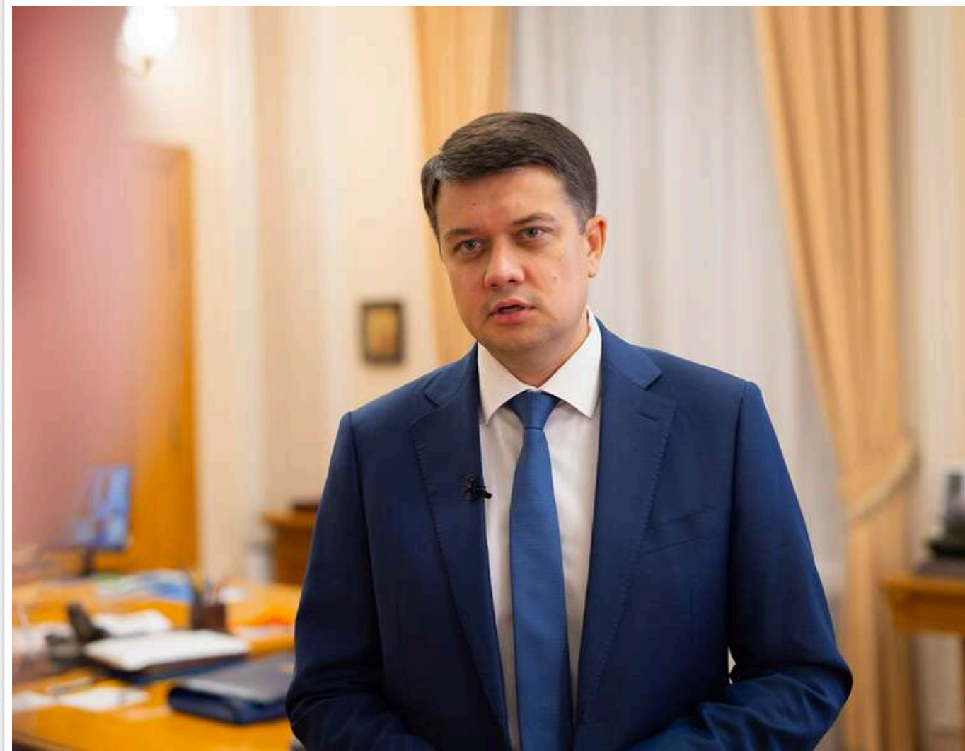
«Лише один із семи має шанс вийти з позиції»: Разумков критикує уряд через відсутність термінів служби

Наразі лише один військовий із семи має шанс залишити позицію, а заяви щодо демобілізації тих, хто воює найдовше, – це повний абсурд, – наголосив нардеп Разумков.