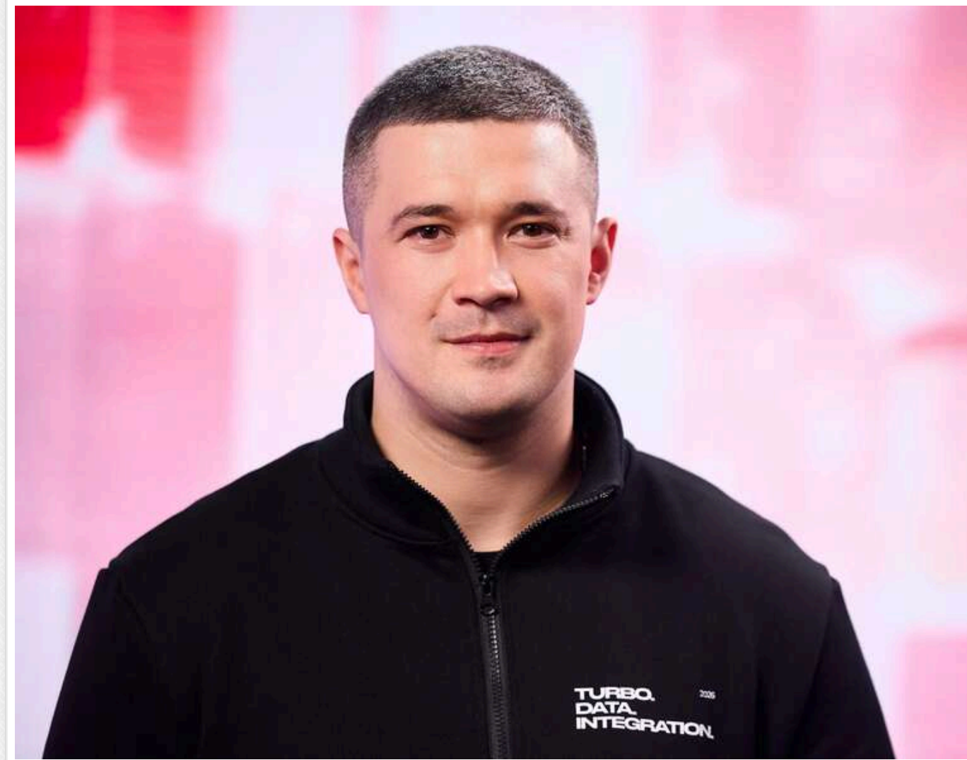
Сили оборони України матимуть перевагу на полі бою в найближчі пів року, - Федоров

У найближчі пів року Сили оборони України матимуть перевагу на полі бою, – Федоров.