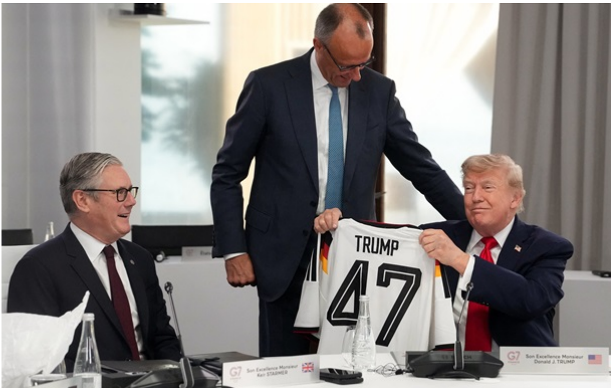
Трамп на саміті G7

Американський лідер запропонував Європі "бартер" - він посилить тиск на Росію, натомість європейці допоможуть йому в Ормузькій протоці.