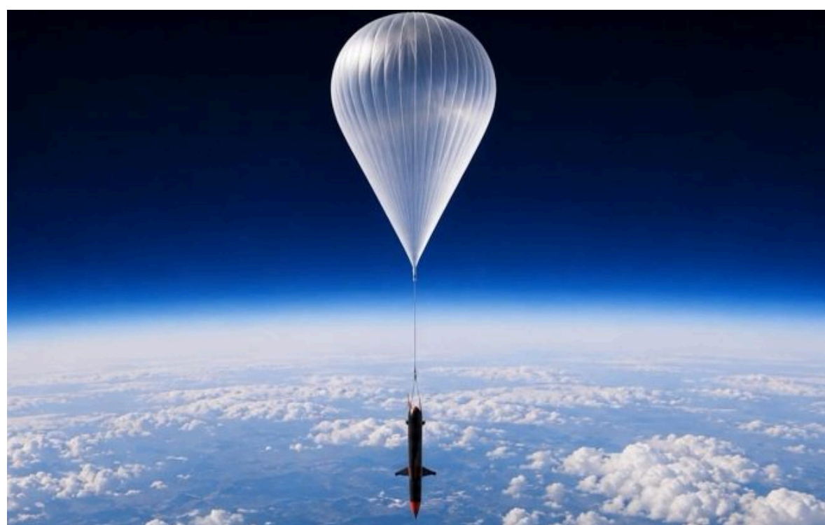
Фото: українська ракета DART для аеростатів (Center of Innovative Technologies Program)