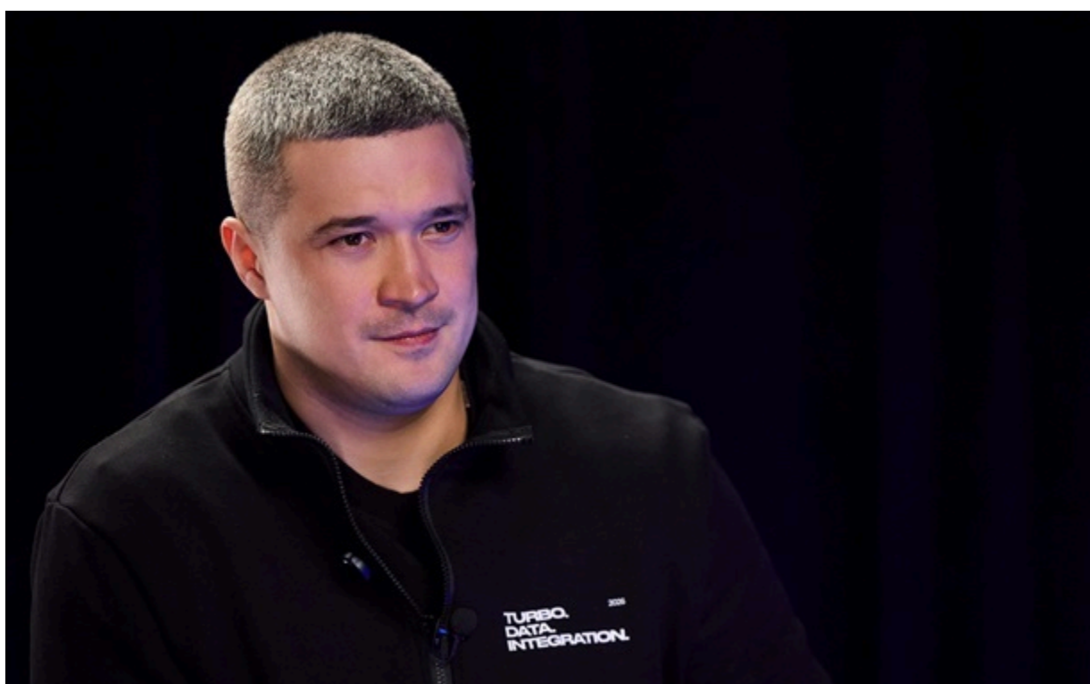
Фото: Михайло Федоров / Телерадіо Мінстр оборони Михайло Федоров

Нова реальність, яка вже сформувалася на полі бою, дає Силам оборони відрив принаймні у пів року.