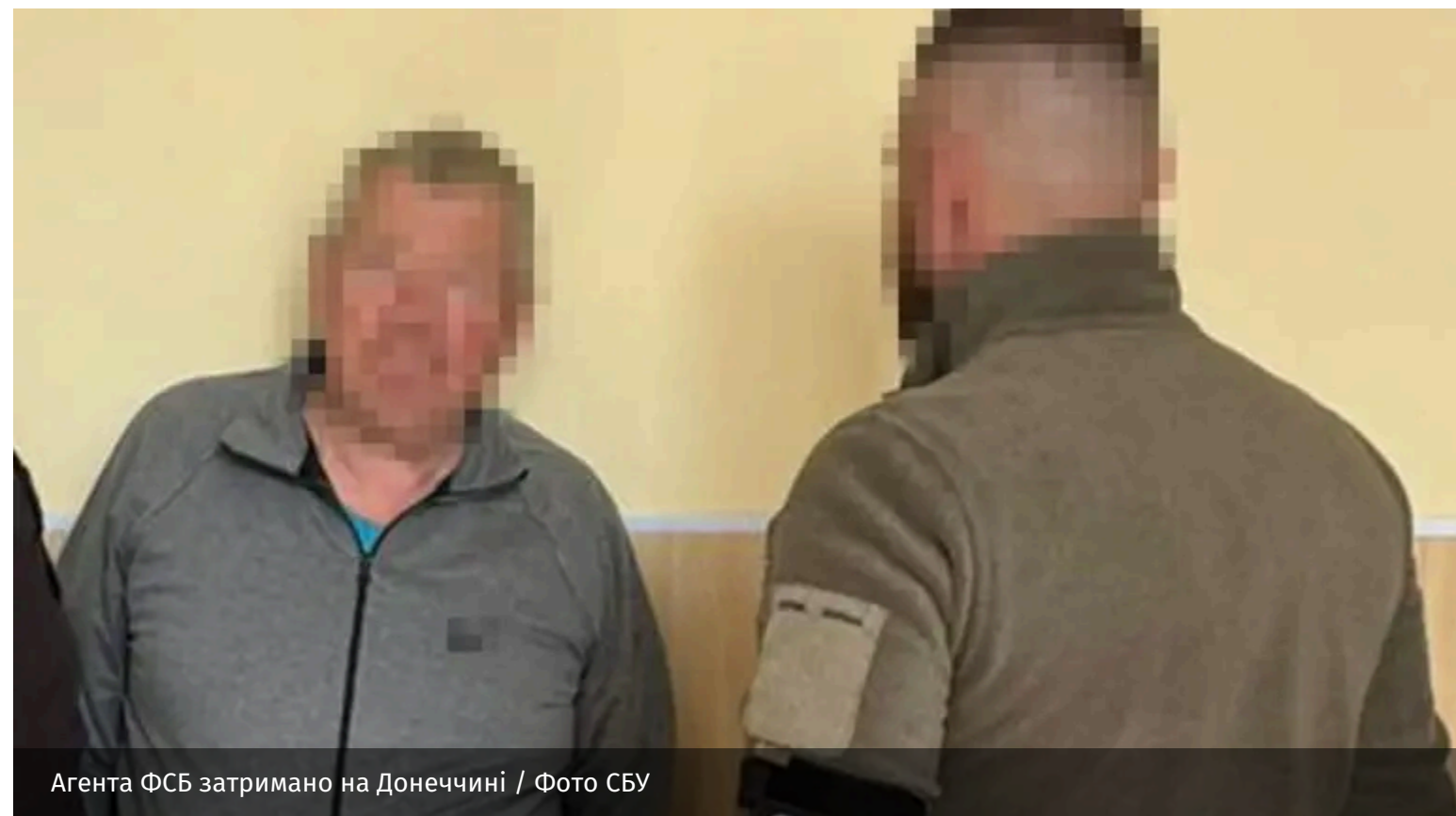
Агента ФСБ затримано на Донеччині

На Донеччині затримано чергового агента російської ФСБ. Шпигун вишукував позиції Сил оборони поблизу Дружківки, щоб передати дані про них ворогу.