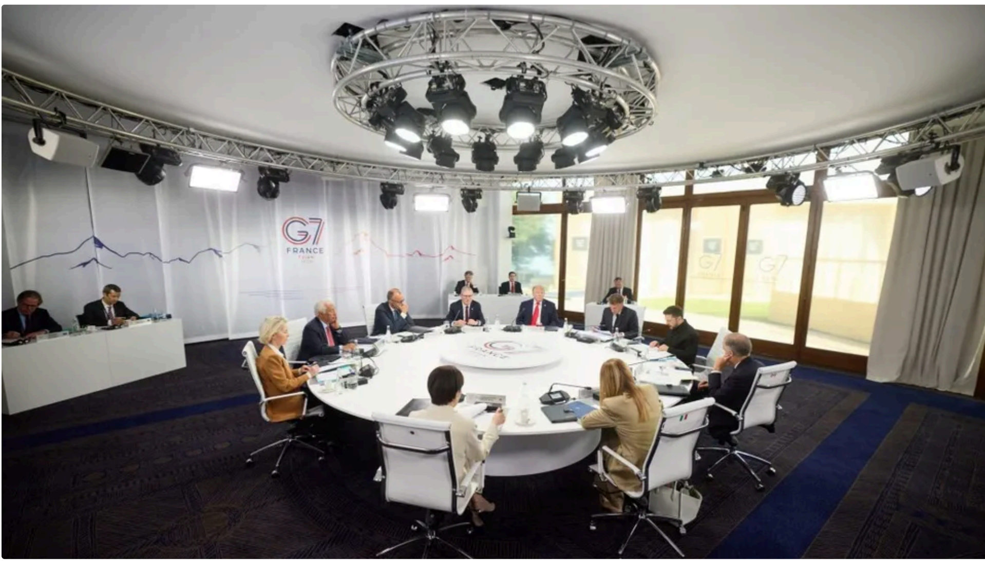
Лідери країн G7 обговорили спільний тиск на РФ

16 червня, 23.36 Этот материал также можно прочитать на русском