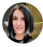
Автор Діана Сискова