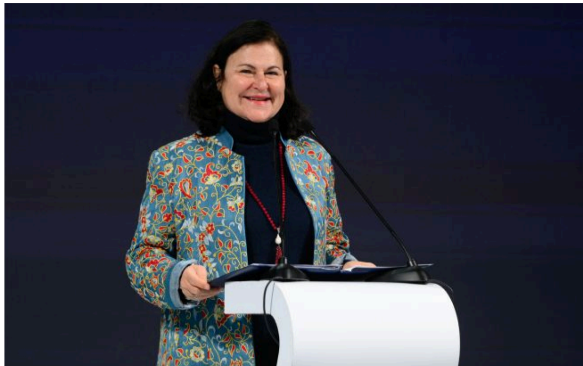
Фото: посол Євросоюзу в Україні Катерина Матернова