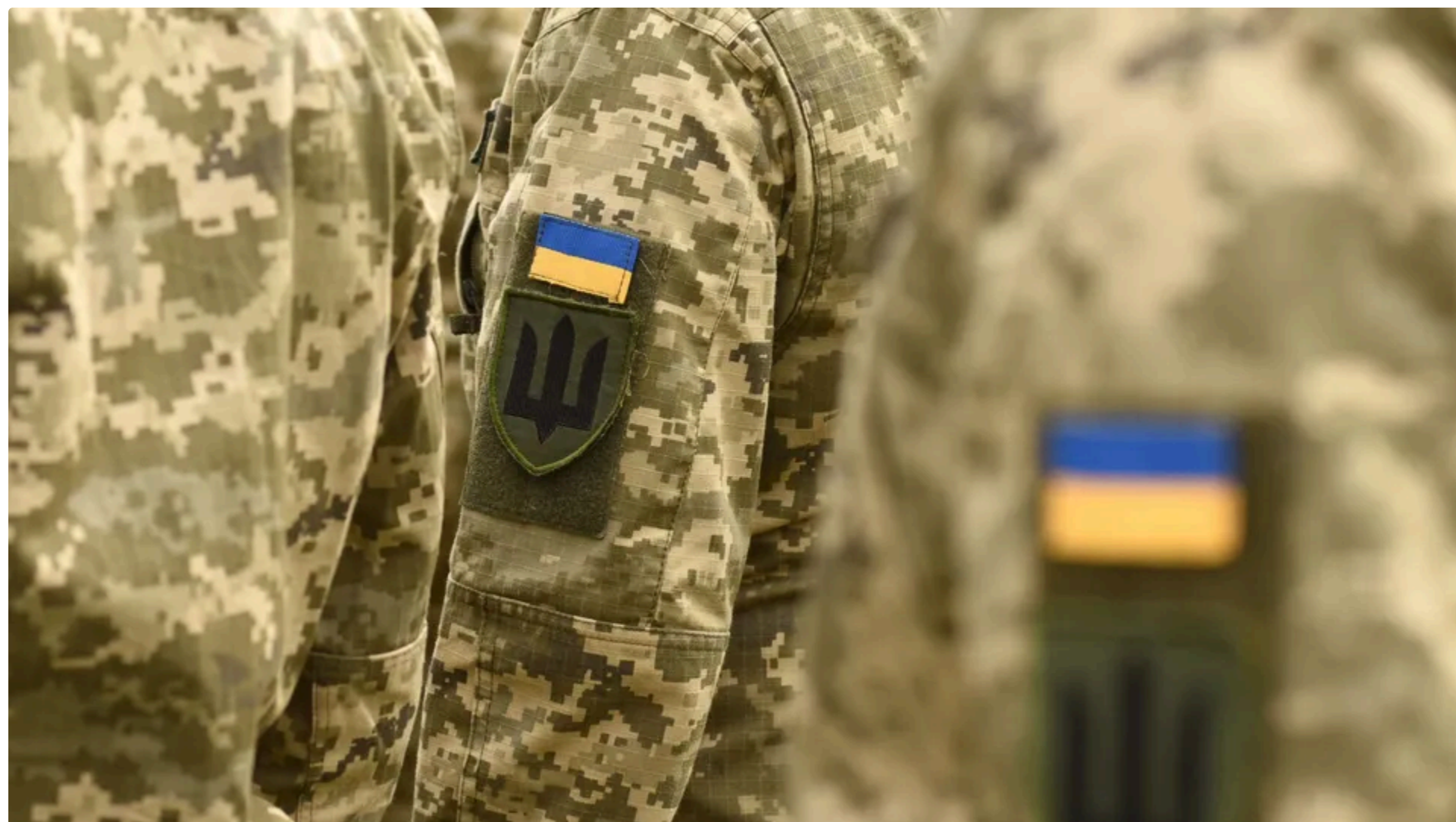
Федоров розповів, коли може початися часткова демобілізація в Україні

16 червня, 22.52 🗨️ Этот материал также можно прочитать на русском