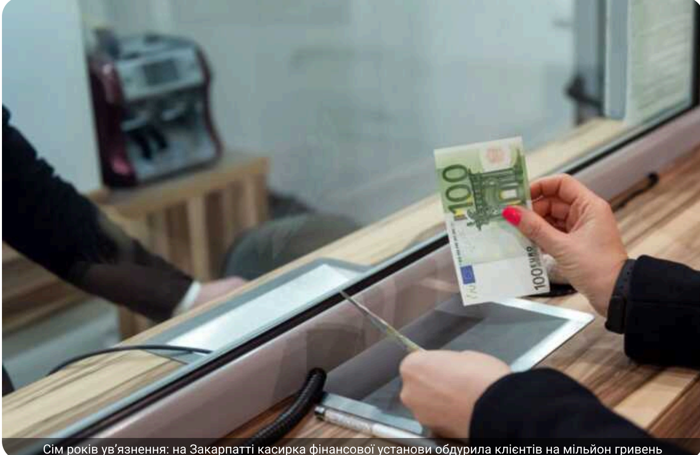
Сім років ув'язнення: на Закарпатті касирка фінансової установи обдурила клієнтів на мільйон гривень

Тячівський районний суд Закарпатської області 11 травня 2026 року ухвалив вирок у справі про масштабне привласнення коштів у місцевому відділенні фінансової установи. Рішення суду стало фіналом розслідування резонансного фінансового злочину, що тривалий час залишався у центрі уваги місцевої громадськості.