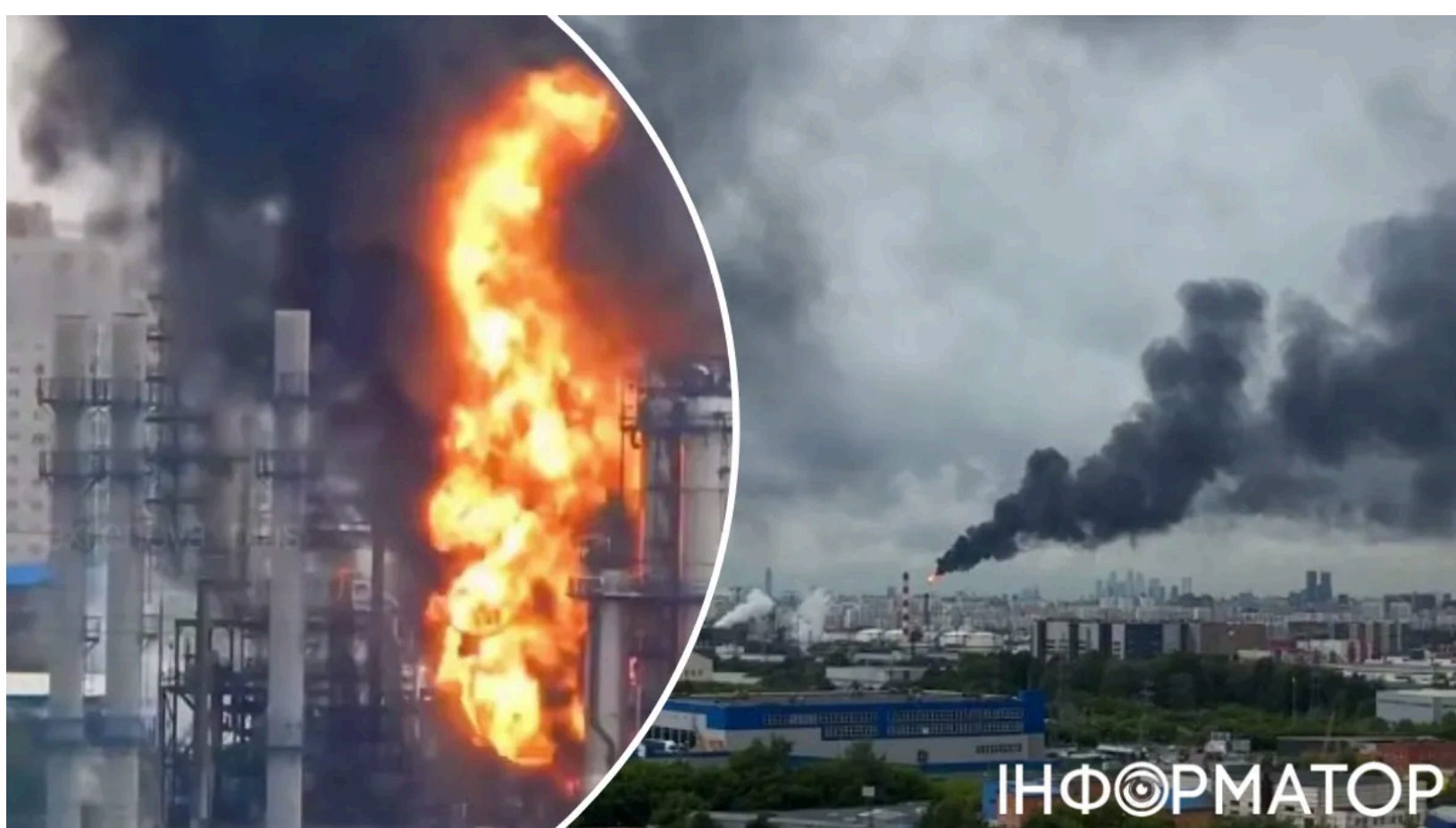
Московський НПЗ зупинив роботу після удару дронів

Московський нафтопереробний завод - головний постачальник палива для московського регіону - 16 червня призупинив роботу після удару українських безпілотників. Мер Москви Собянін підтвердив пошкодження об'єкта , а два галузеві джерела повідомили про повне зупинення виробництва.