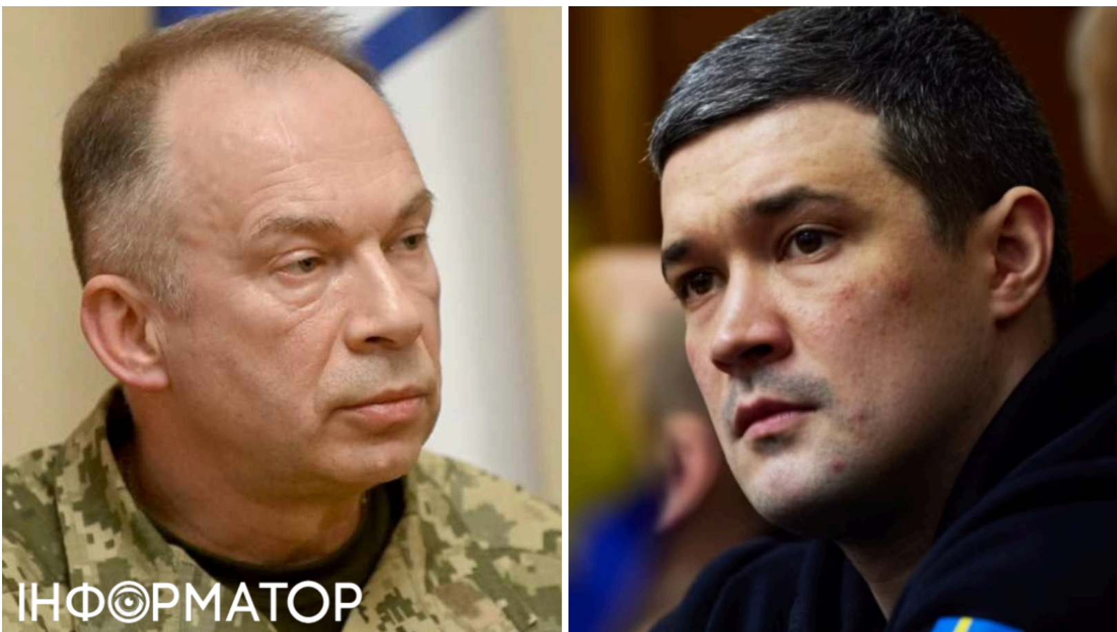
Федоров відповів на чутки про конфлікт із Сирським

Міністр оборони Михайло Федоров відкинув версію про особистий конфлікт із головнокомандувачем ЗСУ Олександром Сирським, проте визнав, що робочі суперечки між ними справді існують. Найбільше розбіжностей стосується фінансового та матеріального забезпечення військових формувань. Попри гострі дискусії, обидва посадовці продовжують спільно готувати реформи для армії. Федоров висловився про це в ексклюзивному інтерв'ю для ТСН у рамках телемарафону "Єдині новини".