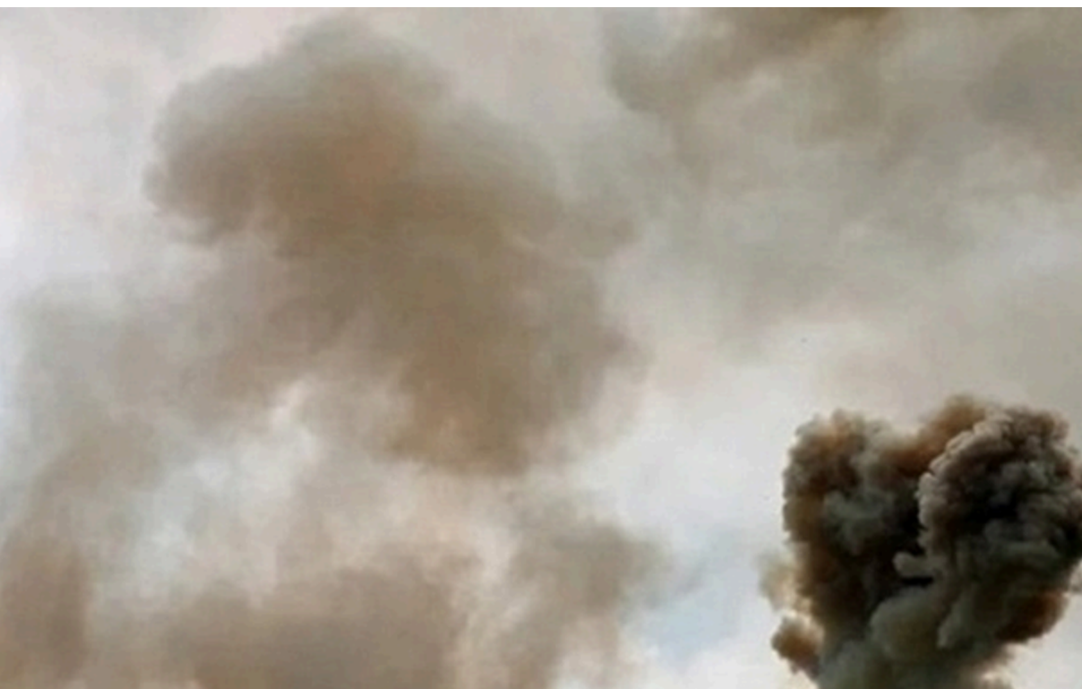
Фото: Соцмережі (ілюстраційне фото) Росіяни вдарили по Чорнобаївці

Медики діагностували в жінки забій грудної клітки, контузію, вибухову та закриту черепно-мозкову травму.