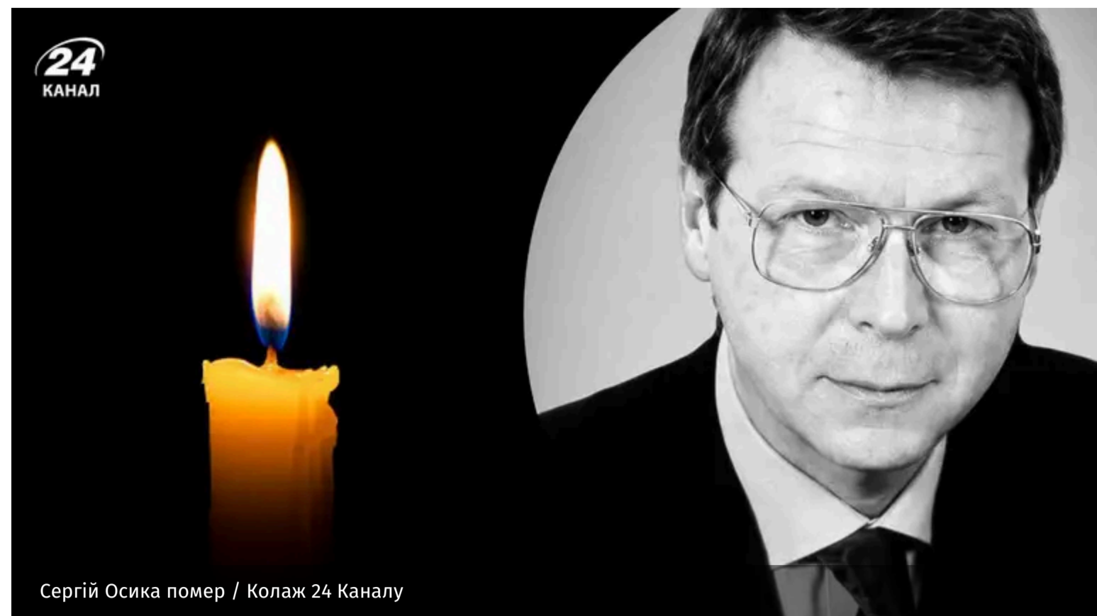
Сергій Осика помер

15 червня помер народний депутат України IV, V та VI скликань Сергій Осика. Він був одним із науковців, які готували проєкт Конституції України до голосування у сесійній залі.