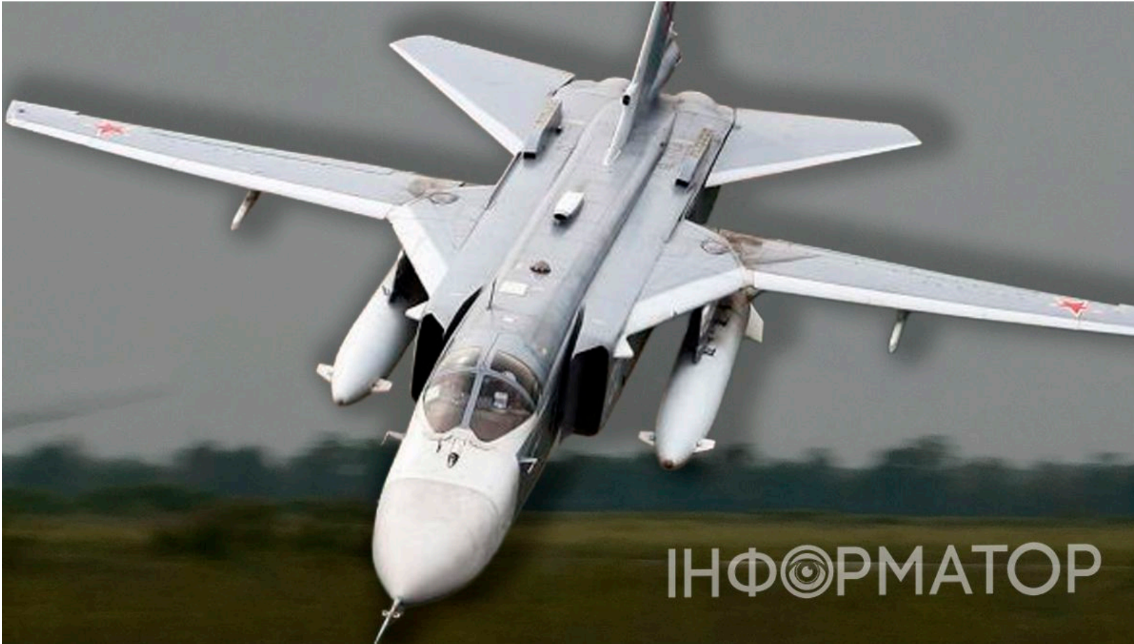
Су-24М розбився на Хмельниччині.

На Хмельниччині увечері 16 червня зазнав катастрофи фронтовий бомбардувальник Су-24М. Обидва члени екіпажу - льотчик і штурман - загинули під час виконання завдання. Серед цивільного населення постраждалих немає. Причини трагедії встановлюються.