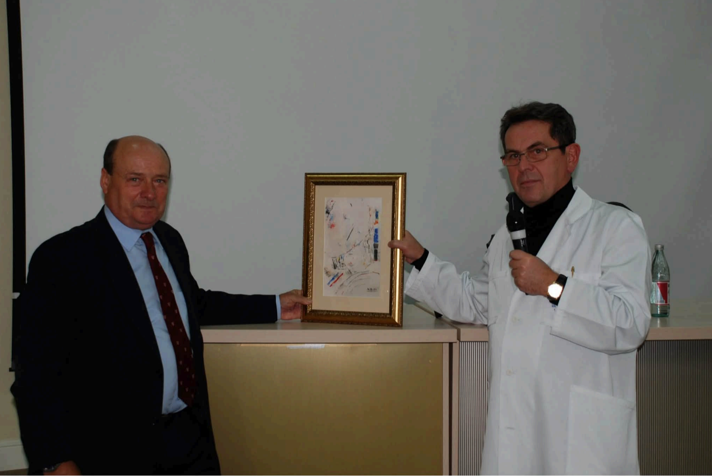
Професор Роджер Мі (Roger B.V. Mee) – видатний дитячий серцево-судинний хірург, один із найвідоміших світових фахівців у галузі хірургії вроджених вад серця

Міжнародні експерти зазначають, що Центр дитячої кардіології та кардіохірургії в Києві під керівництвом професора Іллі Ємця заслужено здобув міжнародне визнання завдяки високим результатам лікування та вагомому внеску у розвиток дитячої кардіохірургії.