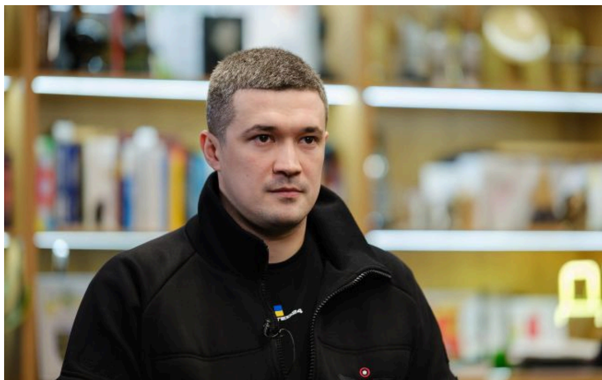
Фото: Михайло Федоров (Віталій Носач, РБК-Україна)