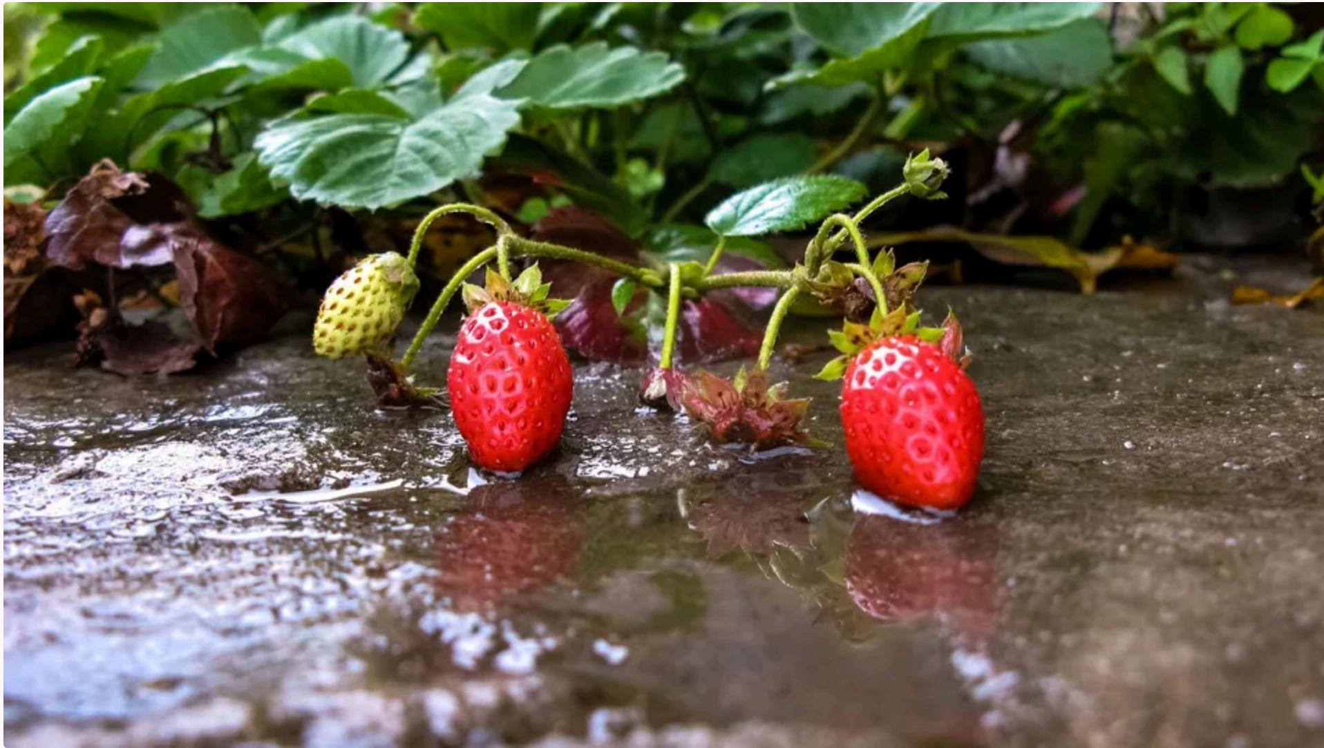
Надмірна волога шкодить полуниці

16 червня, 21.00 🗨️ Этот материал также можно прочитать на русском