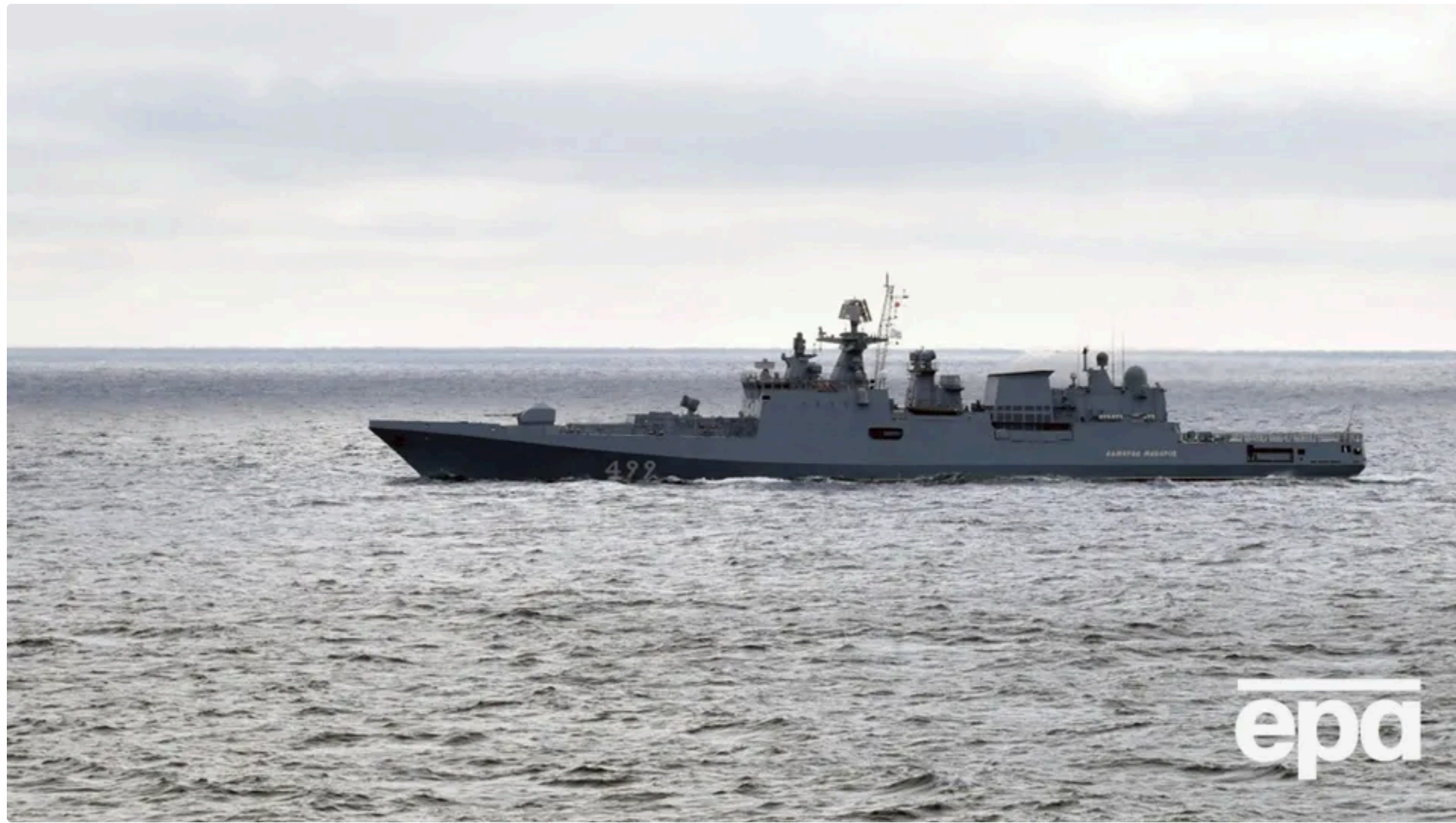
Російський фрегат відкрив постріли у Ла-Манші (ілюстративне)

Військовий корабель країни-агресора Росії "Адмірал Григорович" 16 червня зробив попереджувальні постріли в бік британського судна в протоці Ла-Манш. Днем раніше Великобританія вперше затримала судно російського "тіньового флоту". Про це написала The Telegraph .