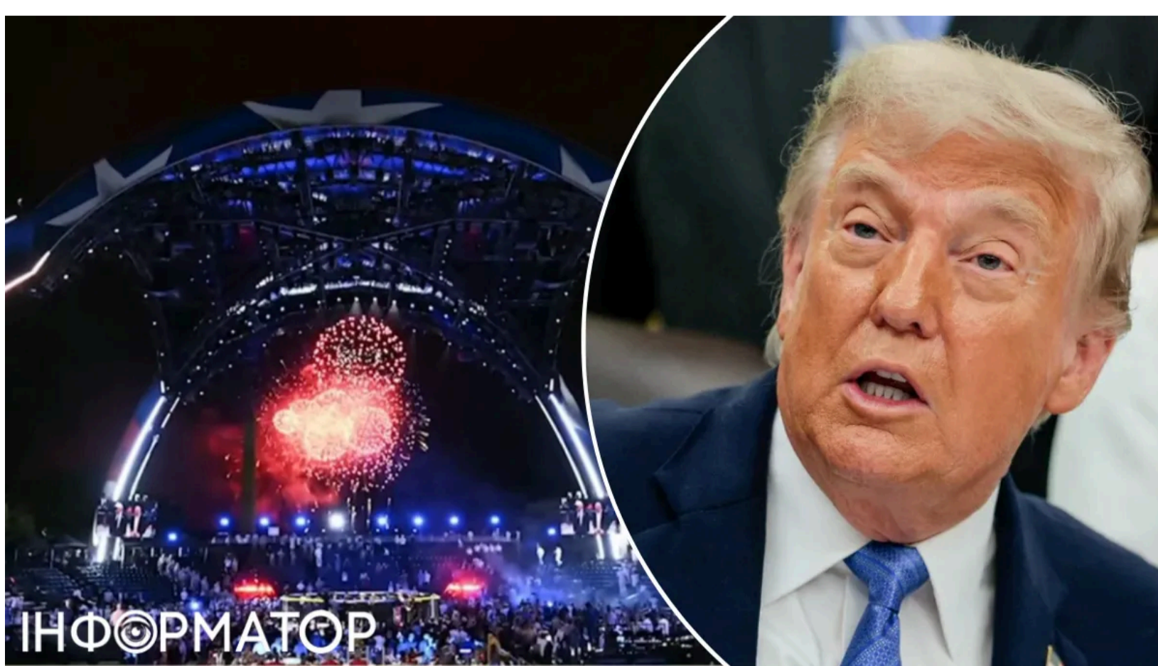
ФБР зупинило теракт біля Білого дому під UFC