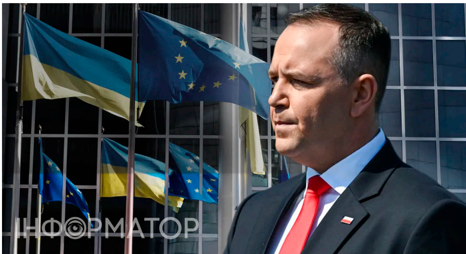
Польща висуватиме вимоги на переговорах про вступ України. Колаж Інформатор

Варшава має намір активно відстоювати власні інтереси на кожному етапі переговорного процесу щодо євроінтеграції України та Молдови. Відкриття перших переговорних кластерів держсекретар Польщі з європейських справ Ігнасій Немчицький назвав лише початком процесу, під час якого Варшава висуватиме свої умови кандидатам.