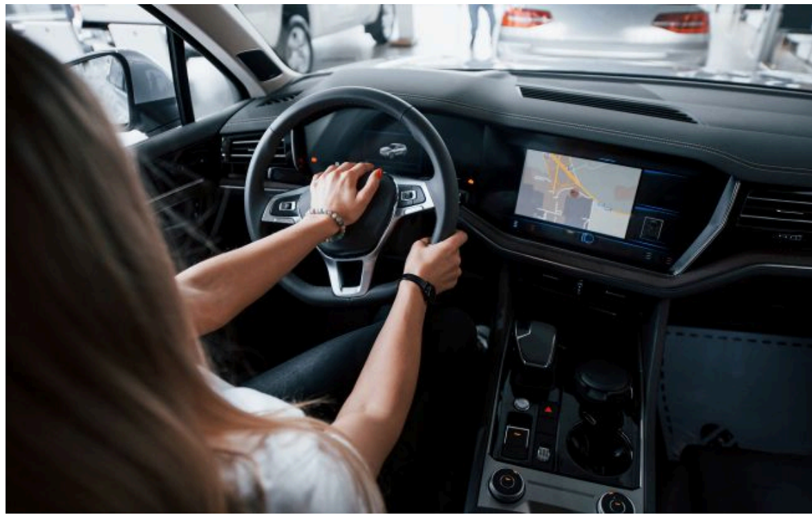
Фото: українці все частіше стикаються зі збоями GPS через РЕБ