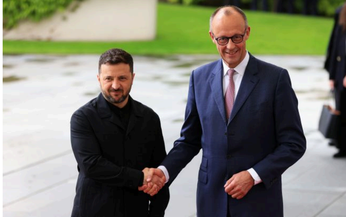
Фото: Володимир Зеленський і Фрідріх Мерц