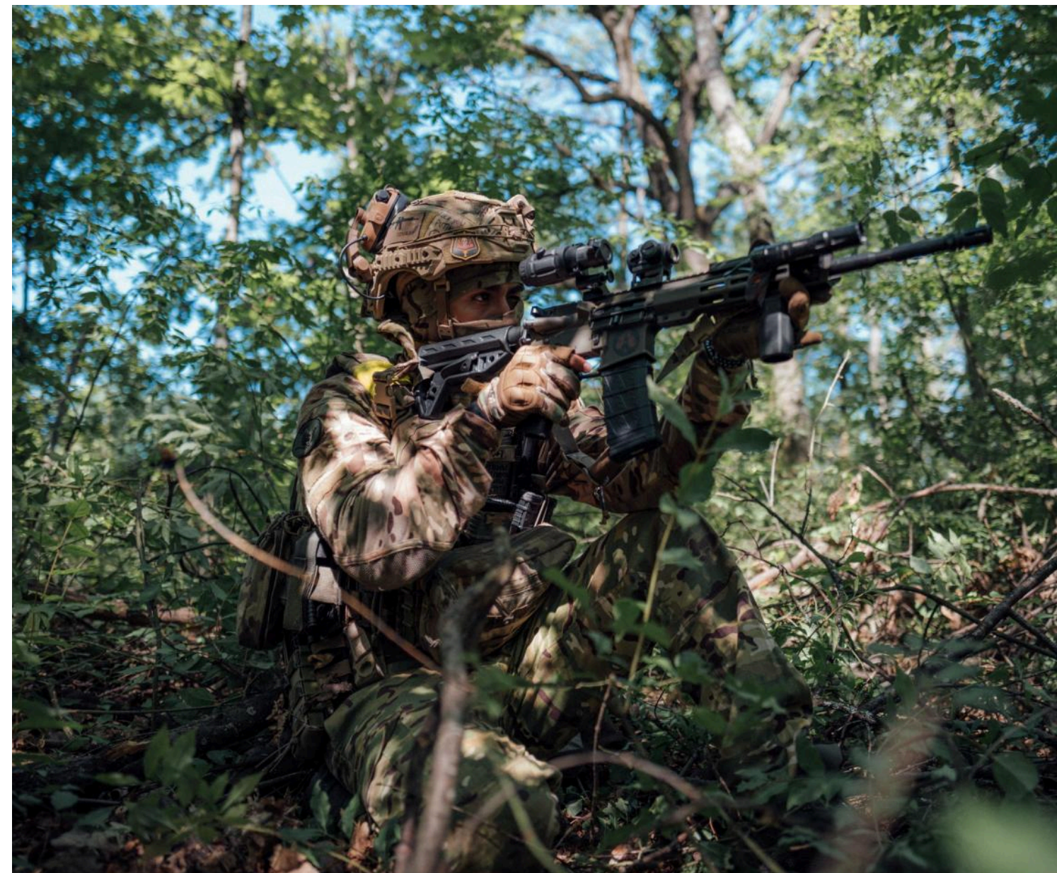
Оборона Костянтинівки ускладнюється / фото 13 Бригада Національної гвардії України "Хартія"

Російські війська посилюють тиск на Костянтинівку з кількох напрямків, намагаючись ускладнити постачання українських підрозділів.