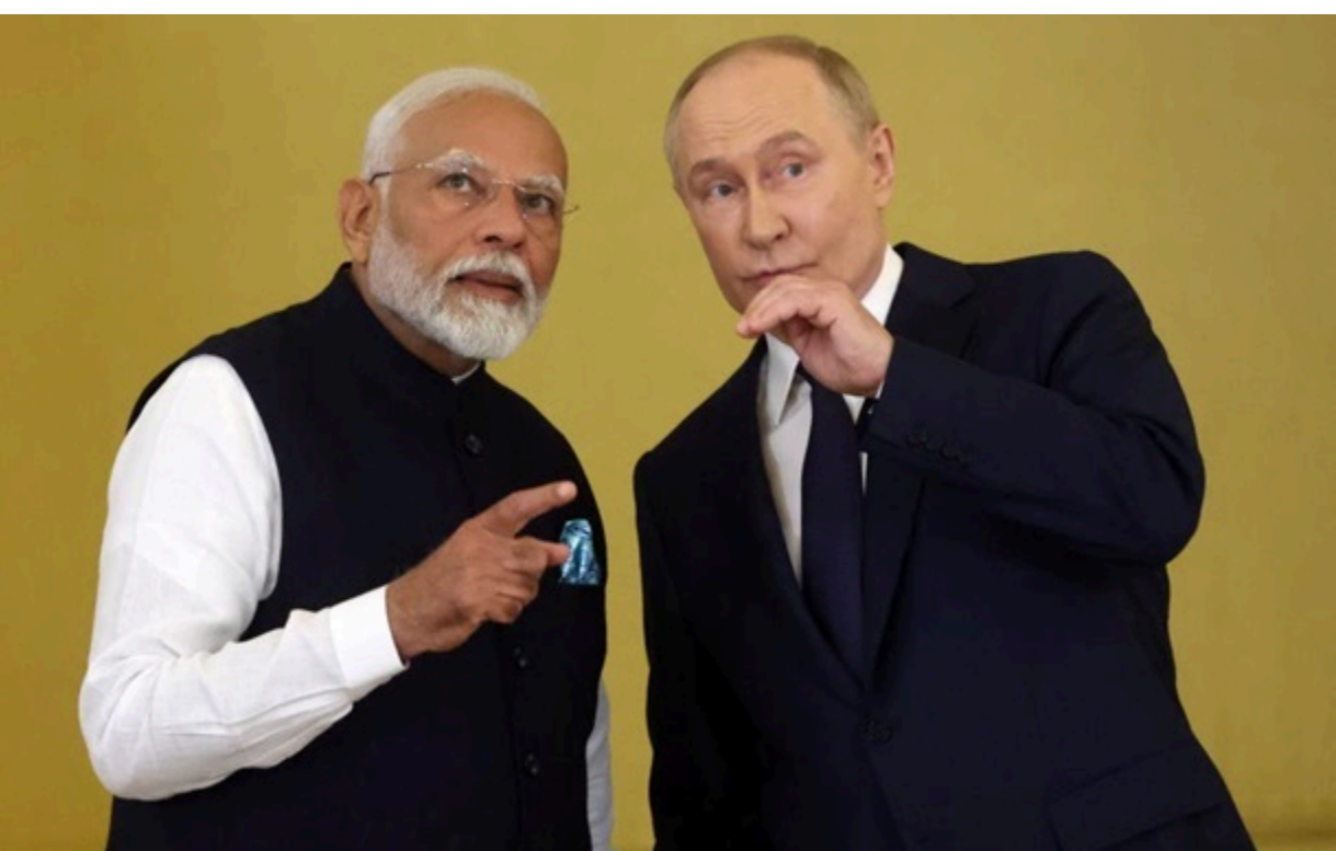
Фото: Getty Images (ілюстраційне фото) Путін та прем'єр-міністр Індії Нарендра Моді

Томторське родовище вважається одним із найбільших у світі неосвоєних джерел рідкісноземельних елементів.