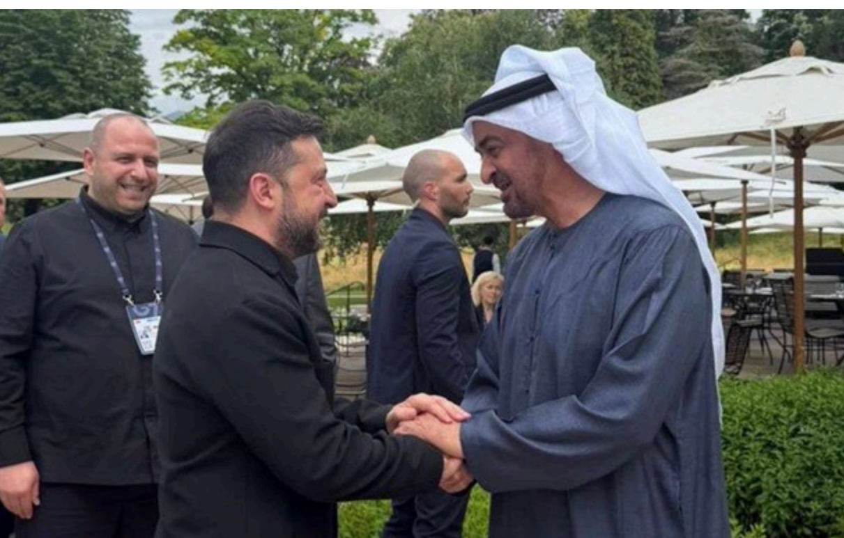
Зеленський зустрівся із президентом ОАЕ

Зеленський нагадав, що українська держава підтримала ОАЕ та інші країни регіону Затоки у складний момент.