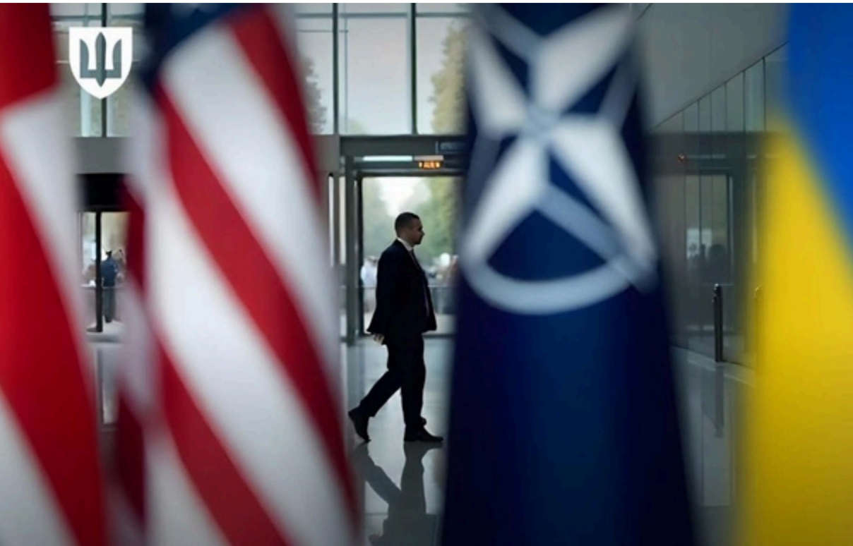
35-те засідання у форматі Рамштайн відбудеться у Брюсселі 18 червня

Засідання у форматі Рамштайн відбудеться 18 червня у штаб-квартирі НАТО в Брюсселі.