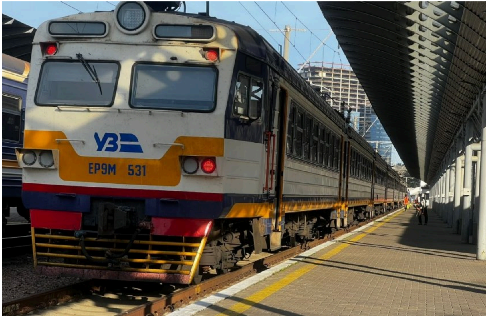
Попит на Карпати зростає: УЗ запускає додаткові поїзди

"Укрзалізниця" призначає додаткові поїзди до Карпат і Закарпаття у відповідь на зростання попиту пасажирів. Компанія перерозподіляє вагони на найбільш затребувані маршрути та збільшує кількість рейсів у напрямку Рахова та Солотвина.