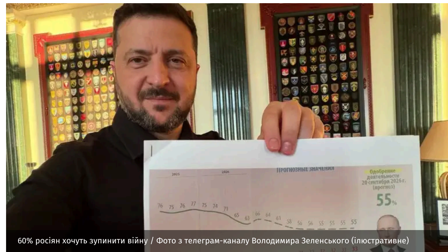
60% росіян хочуть зупинити війну (ілюстративне)

Більшість росіян уже хочуть закінчення війни в Україні. Вони бачать невдачі своєї армії на фронті.