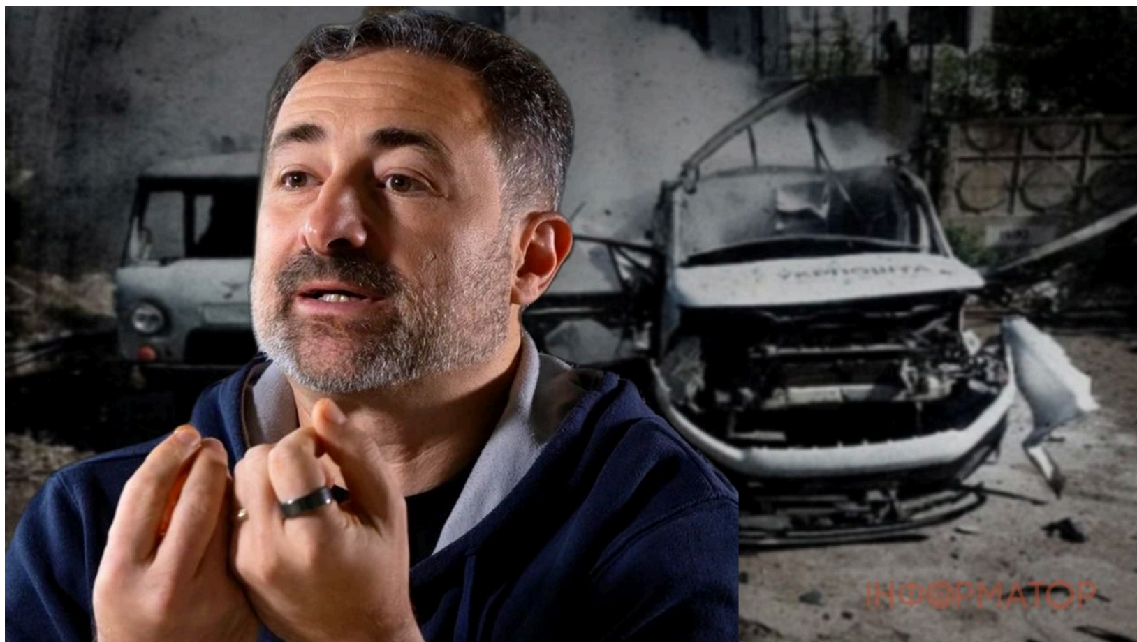
Укрпошта втратила дуже багато авто з початку вторгнення

Ворог атакував автомобіль Укрпошти на Запоріжжі та знищив ще дві машини під час завантаження в Нікополі. Раніше "Інформатор" писав, що затримки доставки через ворожі обстріли фіксували на Донеччині, Сумщині та Херсонщині. За словами гендиректора Укрпошти Ігоря Смілянського, водій пошкодженої на Запоріжжі автівки опинився в лікарні - охоронець встиг надати йому першу допомогу та відігнати машину в безпечне місце.