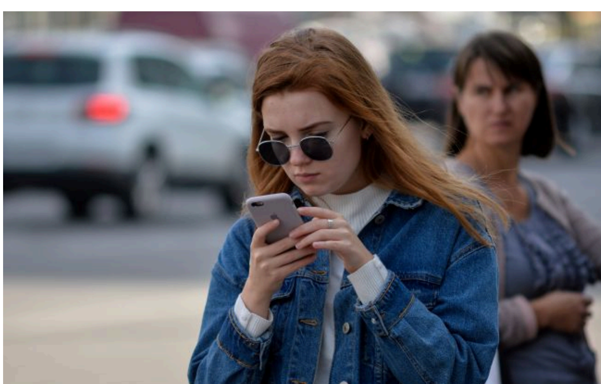
Фото: чи скасують мобільні оператори абонплату

Не витрачай час на шум! Читай тільки суть з РБК-Україна у Google