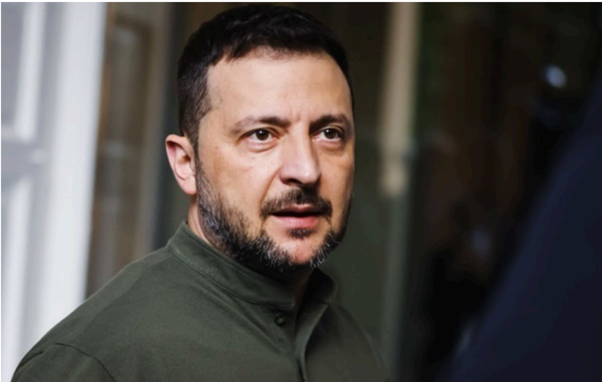
Президент України Володимир Зеленський

Також Зеленський заявив про здатність країни збільшити масштаби виробництва дронів вдвічі.