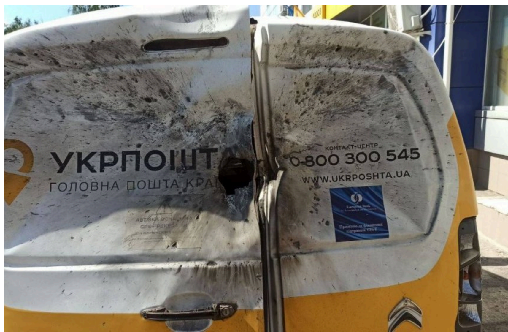
Атаки на "Укрпошту" / Укрпошта

"Укрпошта" повідомила про нові втрати внаслідок російських атак. На Запоріжжі ворожий удар пошкодив службовий автомобіль, водій отримав поранення та був госпіталізований. Ще дві автівки компанії були знищені під час завантаження в Нікополі.