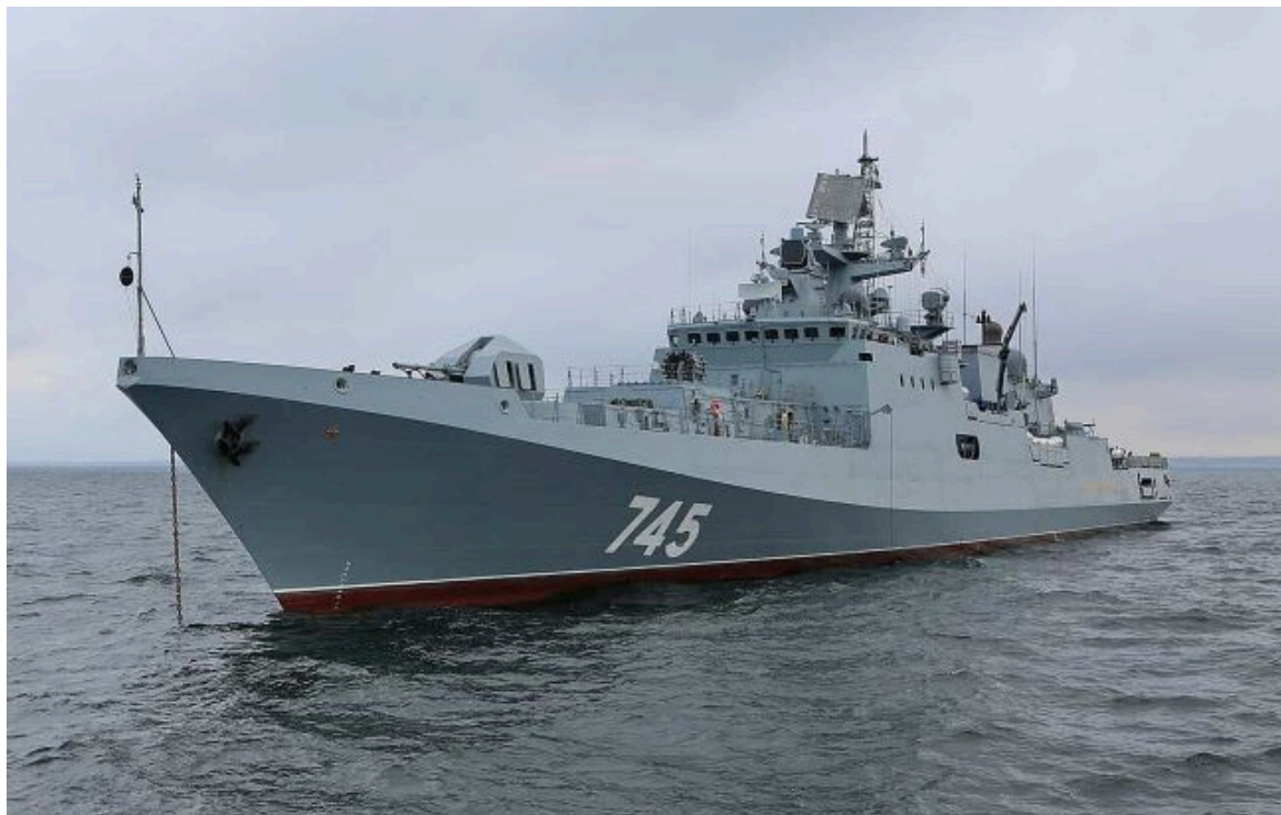
Фото: російський корабель "Адмірал Григорович" (wikipedia.org)