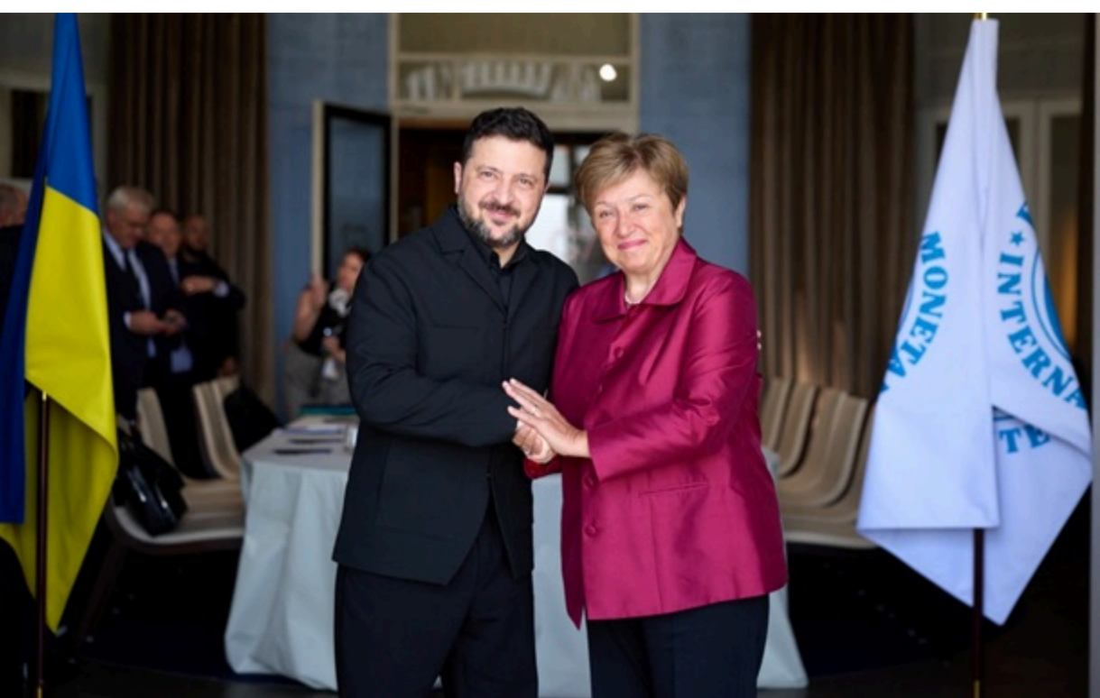
Зеленський провів зустріч з директоркою-розпорядницею Міжнародного валютного фонду

Президент подякував МВФ за підтримку та програми, які допомагають зберігати стійкість економіки України і є важливим сигналом довіри до України для міжнародних партнерів.