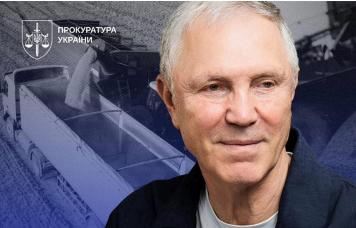
Окупаційний "губернатор" Херсонської області Володимир Сальдо

Суд визнав окупаційного "губернатора" Херсонської області винним у відданні наказу про порушення законів та звичаїв війни.