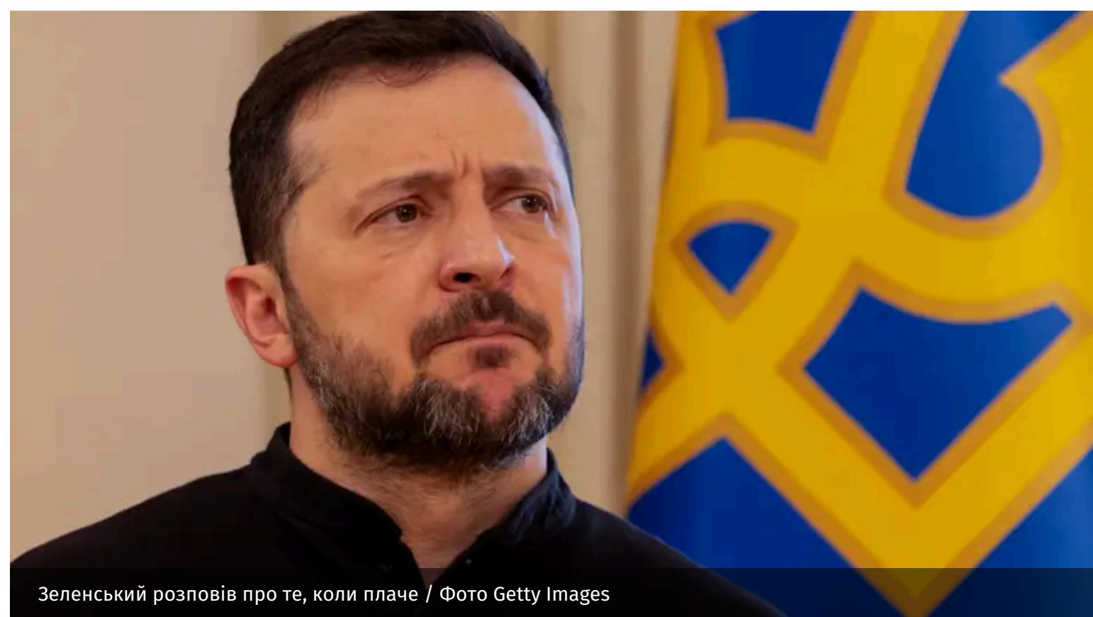
Зеленський розповів про те, коли плаче

Втрати, яких зазнає Україна щодня як на полі бою, так і в тилу, завдають непоправного болю їхнім рідним і близьким. За словами Володимира Зеленського, саме через такі трагічні звістки він часто не може стримати емоцій.