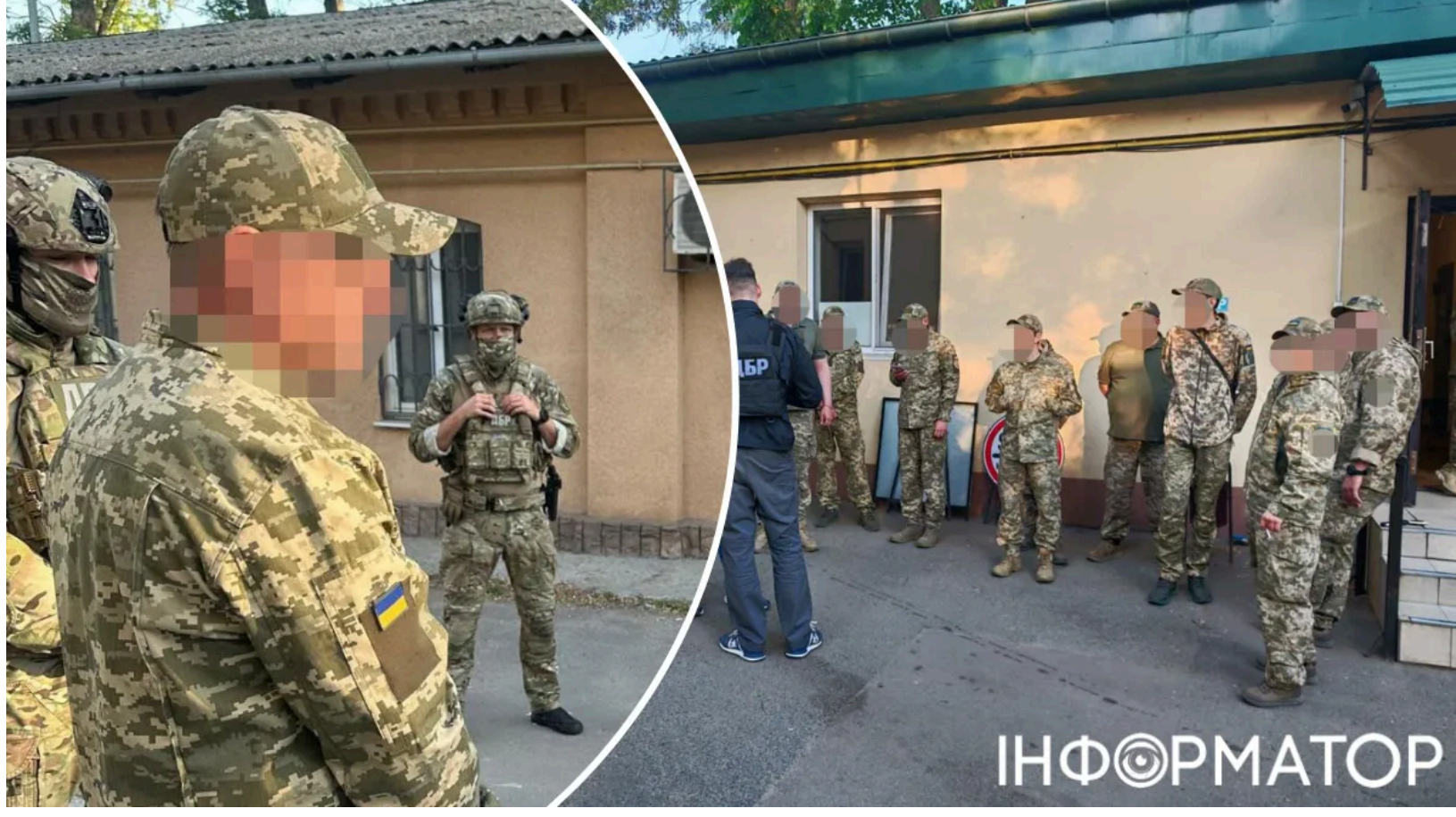
ДБР викрило групу працівників РТЦК на Одещині

Дев'ятьох осіб заарештували на Одещині у справі про систематичне катування чоловіків у районному територіальному центрі комплектування та соціальної підтримки. Слідство встановило, що заради покращення статистики мобілізації посадовці разом із "активістами" громадської організації утримували людей силою, застосовували фізичне насильство та чинили сексуальні злочини. Суд обрав усім фігурантам тримання під вартою без права на заставу. Про це йдеться у матеріалах Державного бюро розслідувань.