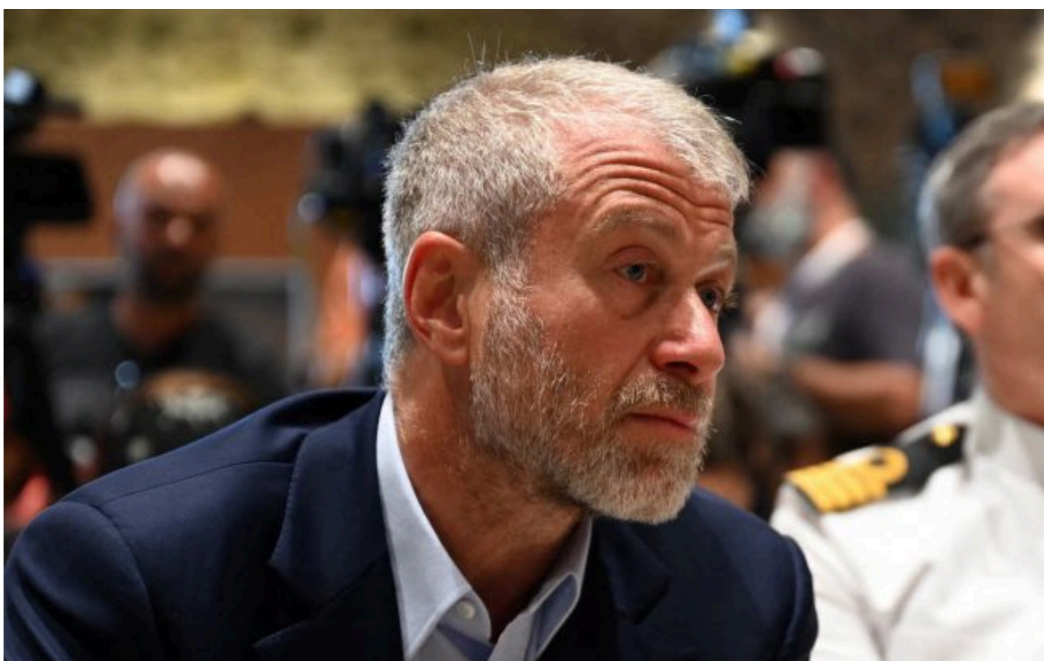
Фото: Роман Абрамович, російський олігарх

Не витрачай час на шум! Читай тільки суть з РБК-Україна у Google