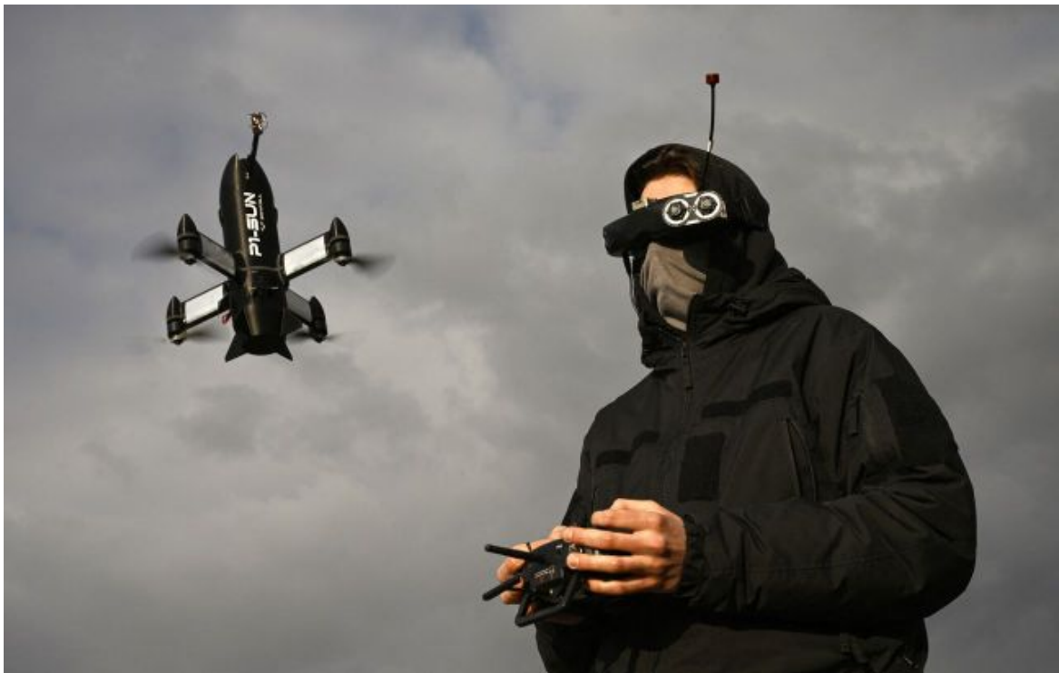
Фото: в Україні показали дрон-перехоплювач P1-SUN Long

Розумій ситуацію на фронті, а не чутки з РБК-Україна у