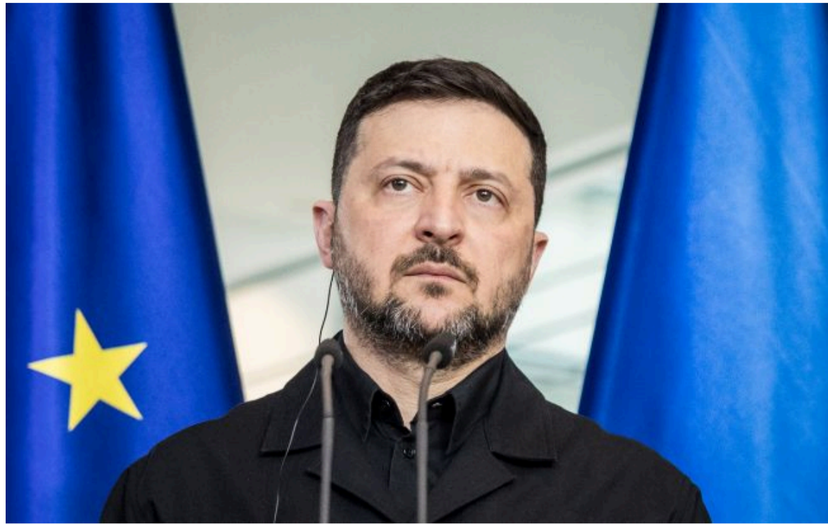
Фото: Володимир Зеленський, президент України

Розумій ситуацію на фронті через факти, а не чулки з РБК-Україна у Google