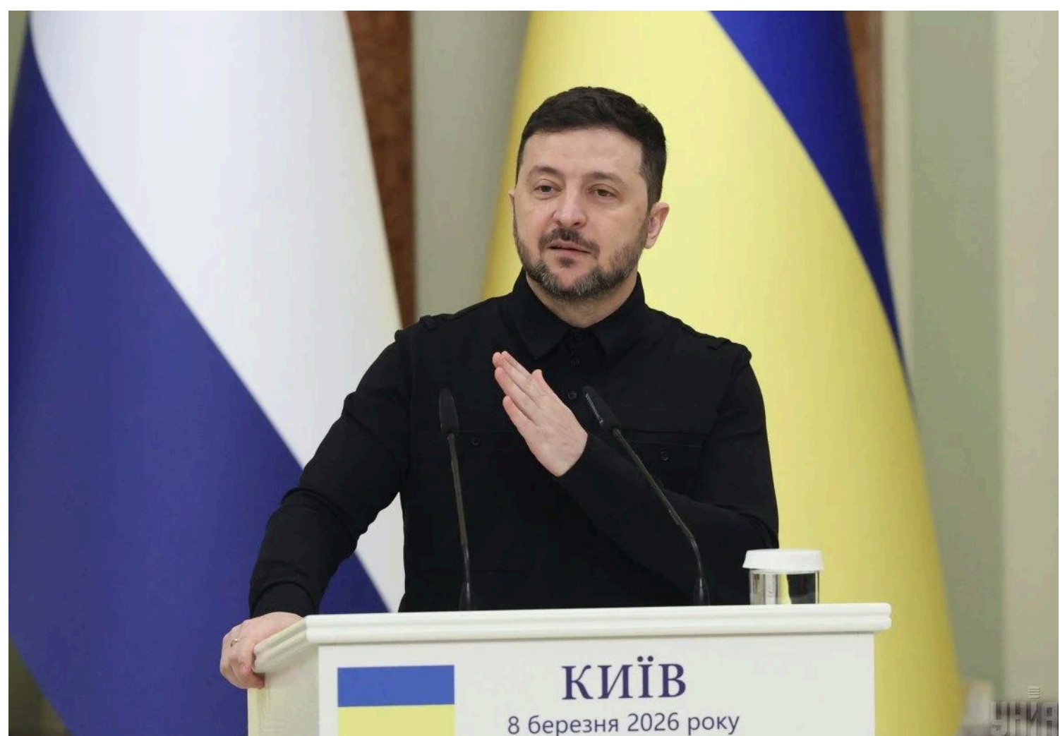
Зеленський вважає, що важливо організувати зустріч президентів України та Росії до зими

Президент зазначив, що під час зустрічей на полях "Великої сімки" усі визнали, що Путін не хоче зупиняти цю війну.